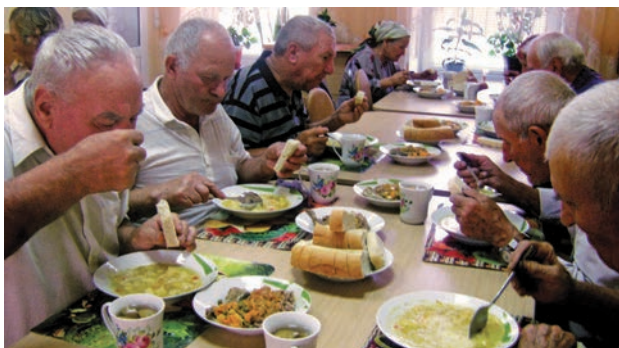
Centrul de Plasament Temporar al Bătrânilor, comuna Calfa, raionul Anenii Noi

Circa 25 mii persoane, inclusiv circa 4 mii persoane cu dizabilități, ceea ce constituie 17% din total beneficiari beneficiază anual de îngrijire socială la domiciliu.