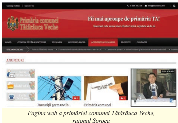
Pagina web a primăriei comunei Tătărauca Veche, raionul Soroca

O bună practică privind guvernarea digitală este transmiterea de informații în format electronic către aleșii locali. Așadar, concluziile ședințelor consiliului raional sau local pot fi trimise prin intermediul serviciilor de poștă electronică sau inscripționate pe suport optic. De asemenea, ședințele pot fi transmise și online. Metode de bune practici în consultarea cetățenilor pot fi căsuțele de e-mail specializate, unde cetățenii pot trimite opinii sau reclamații cu privire la un anumit domeniu, existența unor surse de informații de tip newsgroup, precum și prin chat. În era new-media, modalitățile prin care autoritățile publice locale se pot face vizibile sunt extrem de extinse variind de la postarea de profile și informații pe rețelele de socializare, până la crearea de pagini de web și bloguri și transmiterea de informații prin newsletter sau alte forme de abonare electronică.