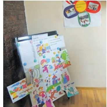
Centrul comunitar „O mână întinsă copiilor”, comuna Cotul Morii, raionul Hâncești