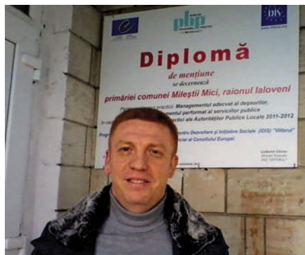
Administrația publică locală din comuna Mileștii Mici, raionul Ialoveni își face publice realizările obținute în cadrul Programului Bunelor Practici 2011–2012

Autoritățile publice locale învingătoare vor avea angajamentul de a organiza și desfășura activități de diseminare a bunelor practici. Specificul acestor activități va depinde parțial și de interesul din partea altor autorități publice locale de a primi informații și instruire în domeniile la care se referă bunele practici, dar și de capacitățile autorităților publice locale care dețin statutul celei mai bune practici. Pentru a beneficia de susținere și cunoștințe în diseminarea bunelor practici, autoritățile locale premiate cu statutul celei mai bune practici vor fi invitate să participe la un program de instruire care îi va ajuta să înțeleagă modalitatea cu care au atins nivelul celei mai bune practici locale; să acționeze în calitate de instructori și să pregătească activitățile de instruire și de informare.