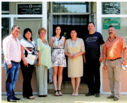
Programul bunelor practici

Totodată, relația cu cetățenii, cu celelalte instituții și cu societatea civilă trebuie să ocupe un rol primordial în planificarea activităților și în stabilirea unei viziuni din partea aleșilor locali în scopul de a interacționa mai bine cu aceste categorii și de a răspunde nevoilor acestora. Un alt aspect important care asigură buna guvernare a unei autorități locale este procesul de informatizare care contribuie la îmbunătățirea serviciilor publice, eficientizarea activității administrative și facilitarea participării democratice.