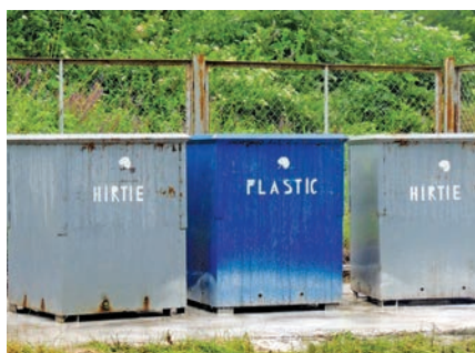
Sistemul de management integrat al deșeurilor în satul Cristești, raionul Nisporeni

regional, fiind acoperite toate localitățile, inclusiv cele rurale. În acest context, trebuie să se înțeleagă că nu contează amplasarea fizică a capacităților de reciclare sau eliminare a deșeurilor, ci extinderea rețelilor de colectare și transportare a deșeurilor. În aceste condiții, se impune realizarea de noi depozite ecologice zonale și crearea de stații de transfer în vederea implementării optime a unui sistem integrat de gestionare a deșeurilor, care să deservească populația din municipii, orașe, comune, precum și din sate.