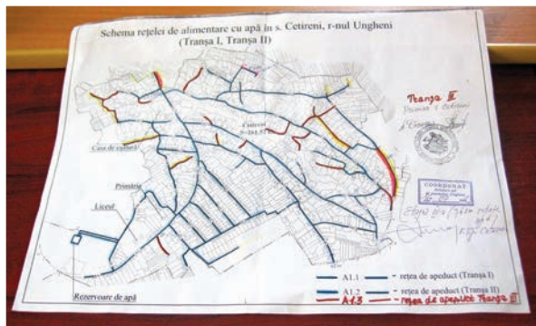
Schema rețelei de alimentare cu apă potabilă în satul Cetireni, raionul Ungheni

a acestora, orientate spre realizarea unei stări fizice și funcționale a cadrului natural și a cadrului construit, care să corespundă necesităților colectivităților umane, în concordanță cu interesul public și potrivit prevederilor de urbanism și amenajare a teritoriului aprobate. Autoritățile administrației publice locale asigură, în condițiile respectării prevederilor legale, gestionarea tuturor terenurilor și construcțiilor cuprinse în limitele administrativ-teritoriale stabilite și răspund de realizarea și exploatarea construcțiilor și amenajărilor de utilitate publică.