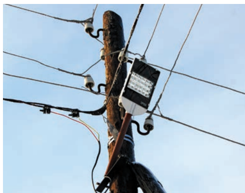
Iluminare stradală eficientă în comuna Tătărauca Veche, raionul Soroca

(Sursa: Ghid de eficiență energetică și resurse regenerabile, Chișinău, 2013)