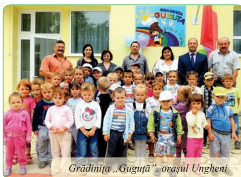
Grădinița „Guguță”, orașul Ungheni

Ediția 2011–2012 a Programului Bunelor Practici a înregistrat un real succes în rândul participanților. Astfel, au fost depuse 50 de practici locale din 39 de localități, dintre care 23 au fost apreciate cu premii și distincții speciale în cadrul Ceremoniei Naționale de Premiere. Totodată, a fost instituit premiul pentru autoritatea publică locală care a implementat și prezentat în cadrul programului cele mai multe practici în perioada 2011–2012.