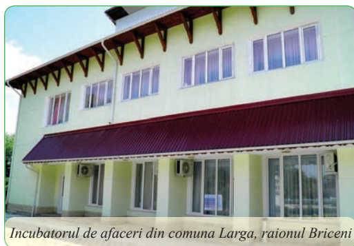
Incubatorul de afaceri din comuna Larga, raionul Briceni

Astfel, programele și politicile locale trebuie să fie axate pe dezvoltarea industriilor producătoare de produse cu