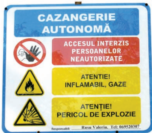
Cazangeria autonomă instalată în cadrul grădiniței „Viorel și Viorică”, comuna Budești, mun. Chișinău

Potențialul de eficiență energetică al Republicii Moldova este foarte mare. La nivel local, acest potențial se referă în principal la încălzirea clădirilor care nu sunt izolate, încălzirea apei menajere, iluminat și sistemele de ventilație. Consumul de energie termică poate fi redus astfel cu cel puțin 40%, iar consumul de electricitate poate fi redus cu 10% în clădirile rezidențiale și cele publice.