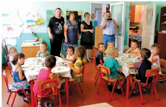
Grădinița din satul Ciumai, comuna Vinogradovca, raionul Taraclia

Serviciile publice incluzive fac referință la acele servicii prestate de către autoritatea publică locală care i-au în considerare, în procesul de prestare a serviciului, necesitățile categoriilor vulnerabile din localitate: copiii lăsați fără grija părinților, familii monoparentale, persoane cu dizabilități sau vârstnici. În acest sens, serviciile educaționale incluzive sunt cel mai des întâlnite. Educația incluzivă este o abordare și un proces continuu de dezvoltare a politicilor și practicilor educaționale, orientate spre asigurarea oportunităților și șanselor egale pentru persoanele excluse/marginalizate de a beneficia de drepturile fundamentale ale omului la dezvoltare și educație, în condițiile diversității umane.