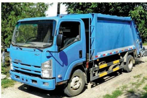
Autospecială utilizată în comuna Mileștii Mici, raionul Ialoveni, pentru transportarea deșeurilor

Gestionarea durabilă a deșeurilor se referă la asigurarea faptului, că deșeurile pe care le generăm sunt gestionate într-un mod controlat pentru a limita impactul asupra mediului al eliminării acestora pe termen scurt, să fie acceptate social și să fie fezabile economic pe termen mediu și lung.