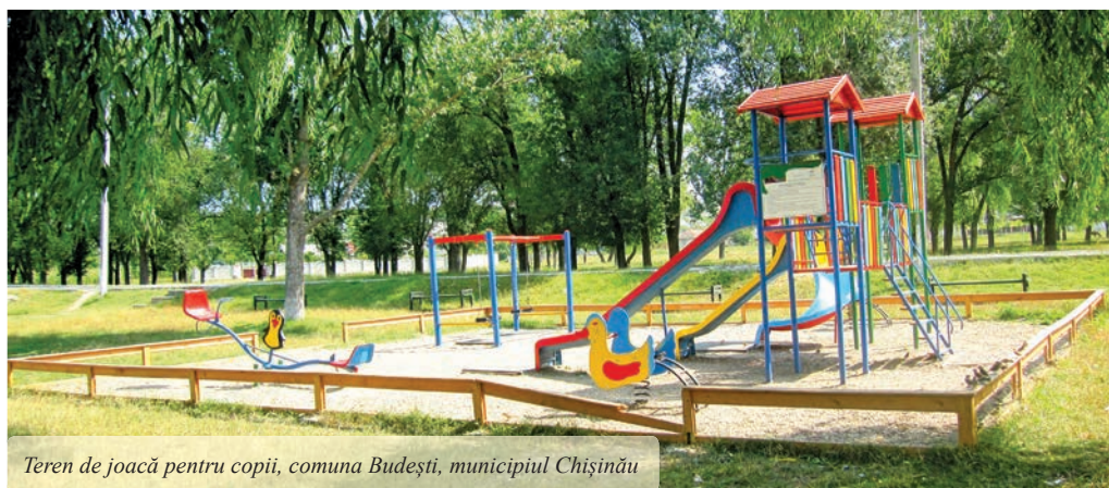
Teren de joacă pentru copii, comuna Budești, municipiul Chișinău

În ultimii ani abordările din câmpul politicilor sociale din Republica Moldova privind grupurile vulnerabile sau dezavantajate din societate au fost extinse prin adăugarea termenilor de excludune și incluziune socială.