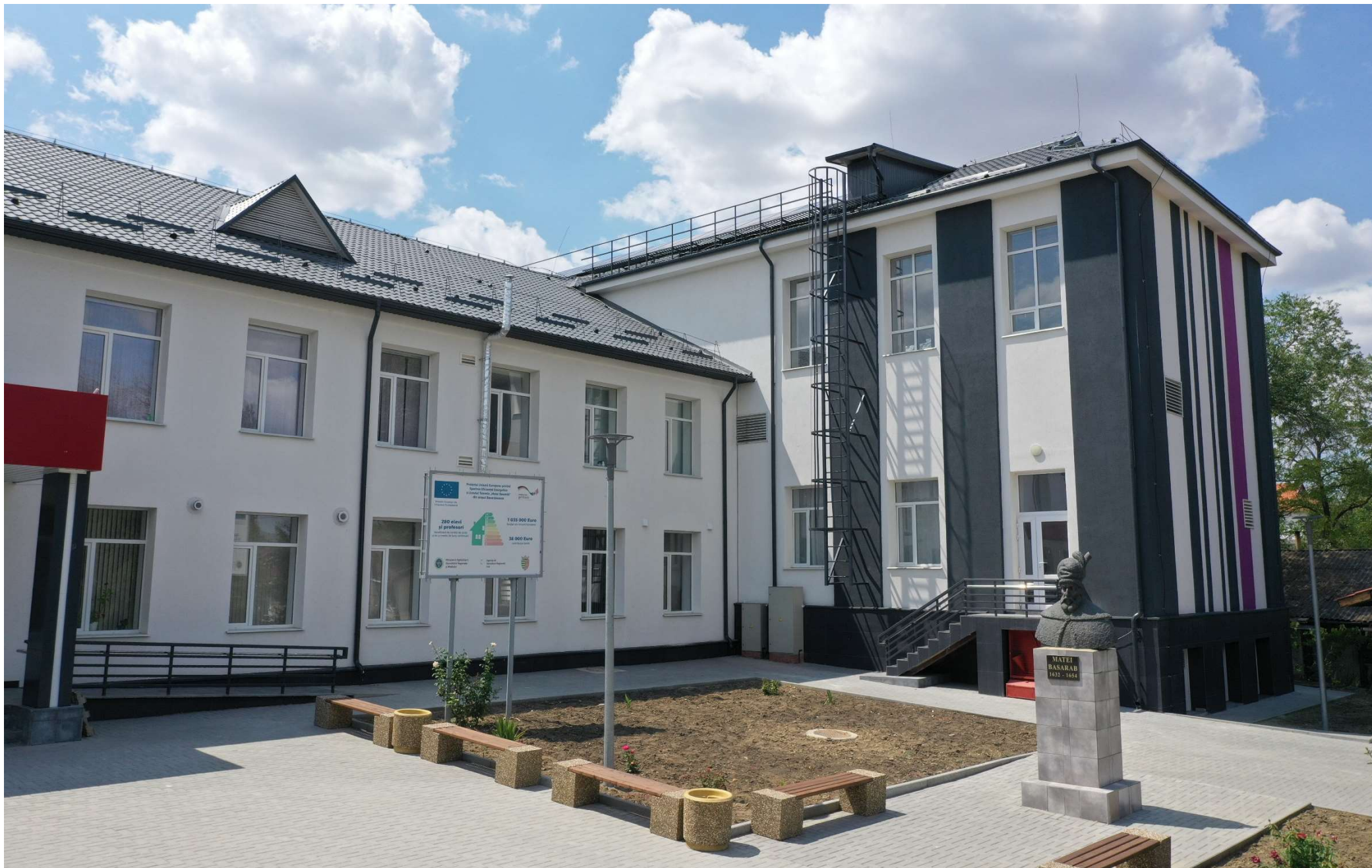
RAPORT FINAL al proiectului „Sporirea eficienței energetice a Liceului Teoretic „Matei Basarab” din orașul Basarabeasca”