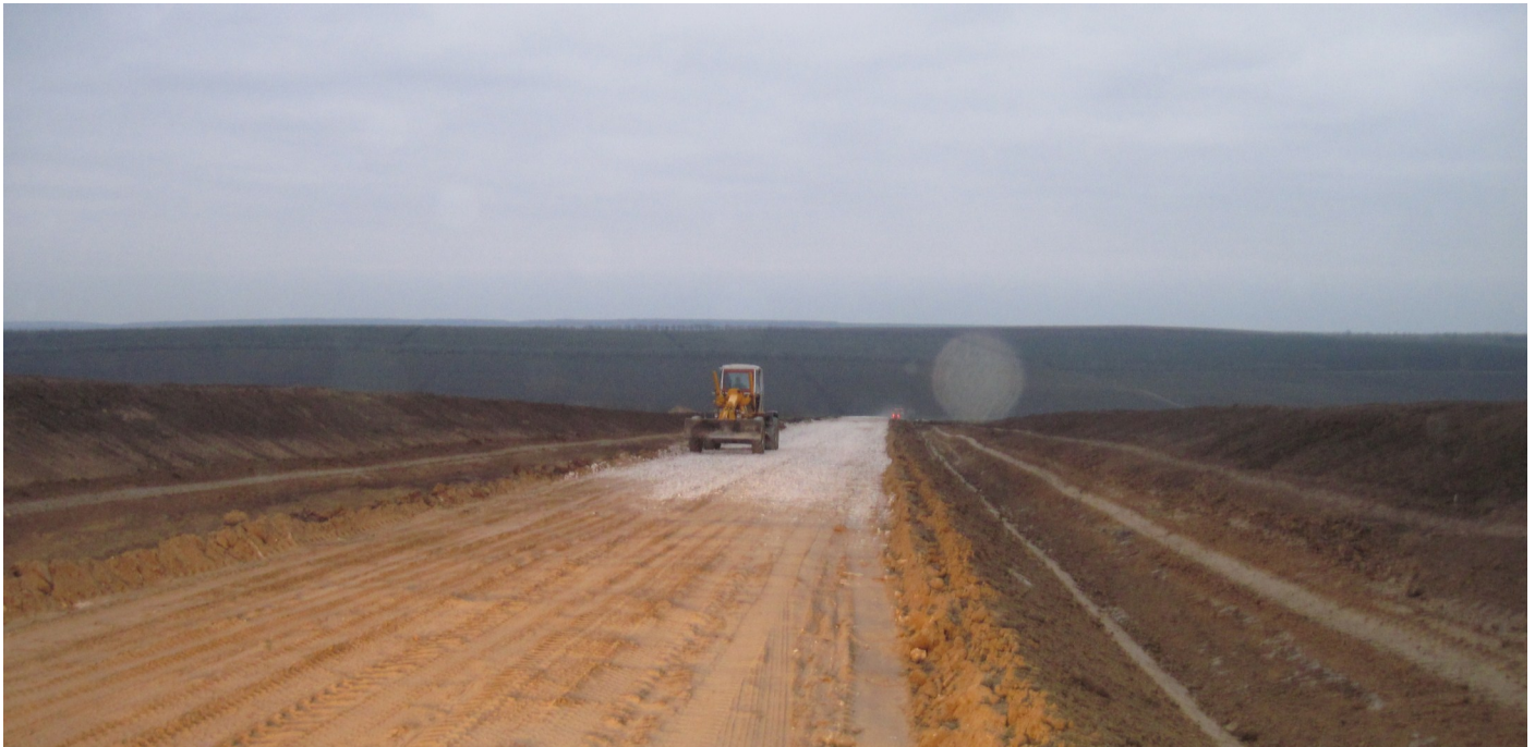
Drumul de acces Dimitrova-Acui, raionul Cantemir

26-30 noiembrie | Regiunea de Sud. O echipă de specialist din cadrul Agenției de Dezvoltare Regională Sud (ADR Sud) au efectuat trei vizite de studiu la proiectele aflate în implementare în Regiunea de Sud. Proiectele implementate în Cahul, Cantemir și Căușeni, în sumă totală de 54 de milioane de lei, sunt gestionate de Agenția de Dezvoltare Regională Sud și finanțate, în cea mai mare parte, din banii Fondului Național de Dezvoltare Regională (FNDR).