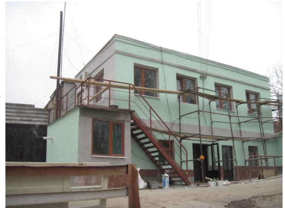
Clădirea dispeceratului Întreprinderii Municipale „Apă-Canal” Cahul în curs de renovare

Sediul întreprinderii municipale „Apă - Canal” Cahul va fi renovat și reutilat până la sfârșitul acestui an. Instituția este beneficiar în urma implementării proiectului-pilot „Îmbunătățirea managementului operațional prestatorului de serviciu „Apă - Canal” Cahul parte a proiectului „Modernizarea serviciilor Publice Locale în Republica Moldova” implementat cu suportul Agenției de Cooperare Internațională a Germaniei (GIZ).