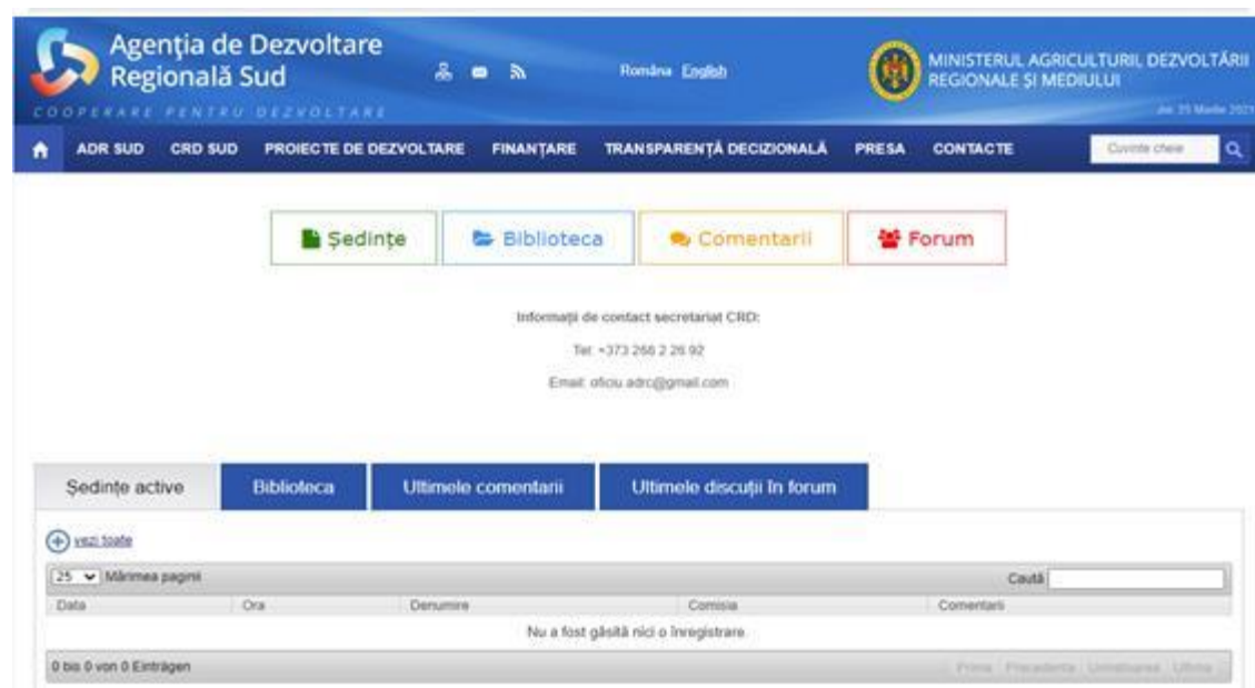
Figura 4. Portalul informațional intranet pe pagina web a ADR

Poșta electronică este folosită, în prezent, în mare parte ca instrument de coordonare a ședințelor CRD. Inițiatorul comunicării este secretarul CRD din partea ADR - sau, în unele cazuri, președintele CRD - care informează membrii despre ședințe planificate sau organizează alte activități.