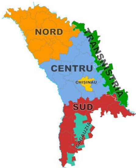
Figura 1: Regiunile de dezvoltare ale Republicii Moldova

Republica Moldova este împărțită în șase regiuni de dezvoltare distincte: Nord, Centru, Sud, Unitatea teritorial-administrativă Găgăuzia. Capitala țării, municipiul Chișinău, este identificată ca o regiune aparte, la fel ca și regiunea transnistreană. Fiecare regiune are propriul specific de dezvoltare, propriul set de probleme și limitări, precum și anumite avantaje specifice. Aceste regiuni sunt vizate de politicile și mecanismele de dezvoltare regională, la care ne vom referi la jos.